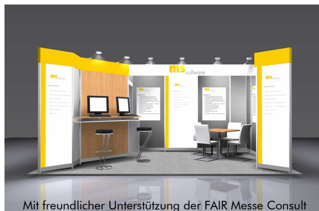
Mit freundlicher Unterstützung der FAIR Messe Consult

Wir laden Sie herzlich ein, Ihre Fragen und Anregungen mit uns zu besprechen.