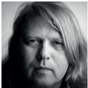
Soenne stellv. mfm-Vorsitzender

Die Mittelstandsgemeinschaft Foto-Marketing (mfm) ermittelt jährlich die aktuellen Honorare für Fotonutzungen in Deutschland und gibt diese unter dem Titel Bildhonorare als Broschüre heraus. Diese Publikation dient seit vielen Jahren Bildlieferanten und Bildnutzern als wichtiges Informations- und Planungsinstrument. Die mfm ist ein Arbeitskreis des BVPA. Im Arbeitskreis sind neben Bildagenturen und Fotografen auch die Organisationen der Fotojournalisten vertreten.